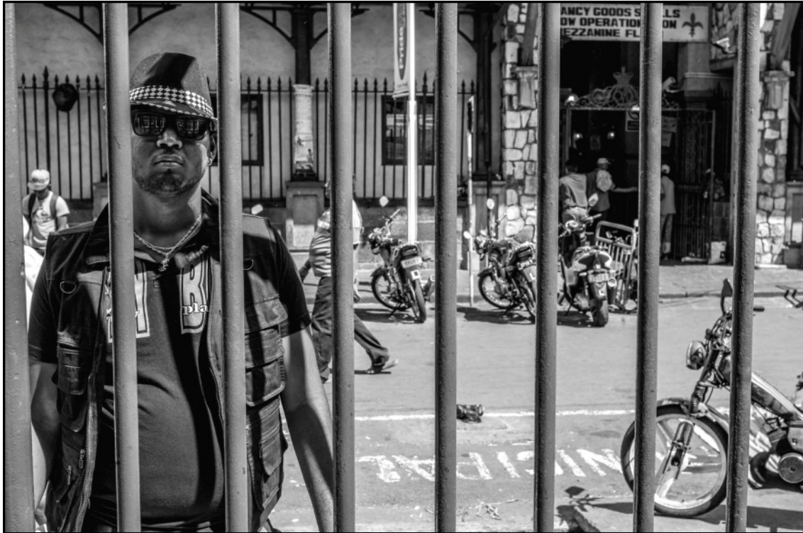
Devant le marché.