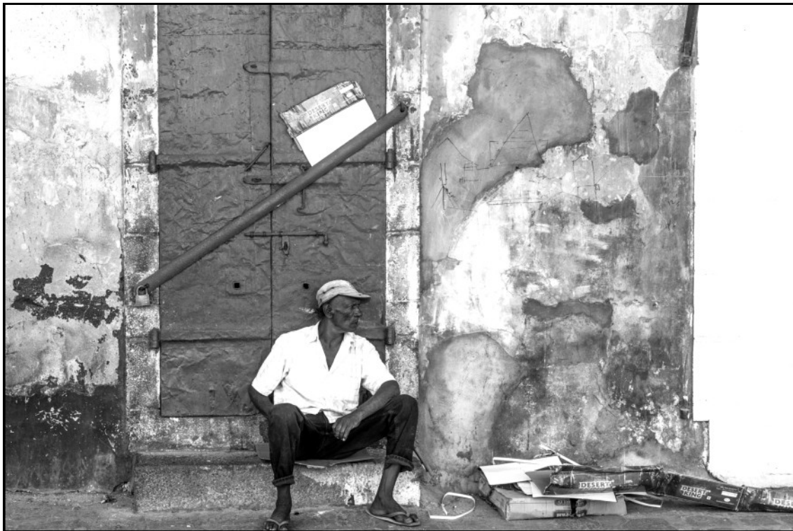
Dans une rue excentrée.