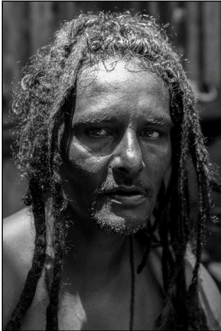
Grand Baie, Cité Lumière 6 novembre Côté cour... Des habitants de cité Lumière.