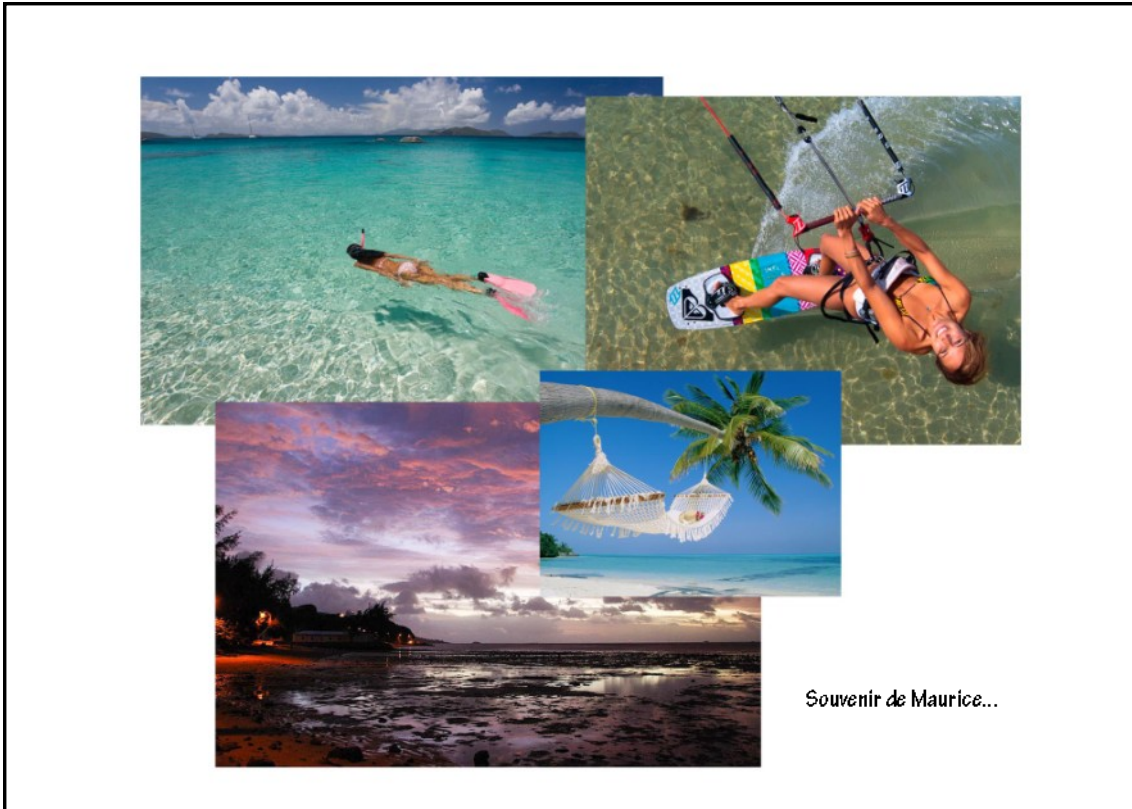
Souvenir de Maurice...

L'île Maurice côté jardin (d'Eden)... (photos Office du Tourisme de Maurice).